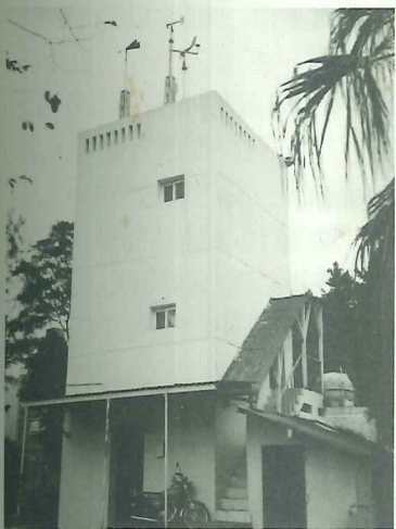
淡水氣象觀測所約成立於1940年代，仍保留日據時期初建原貌。

台北縣政府於六月二十七日正式公告淡水鎮「原英商嘉士洋行倉庫」、「淡水海關碼頭」、「淡水氣候觀測所」及「淡水水上機場」等四處地點為縣定古蹟，使淡水鎮依法保存的古蹟，由原來的十二處增至十六處，此為近年來淡水文化保存運動持續不懈，努力爭取得來的重大成果。