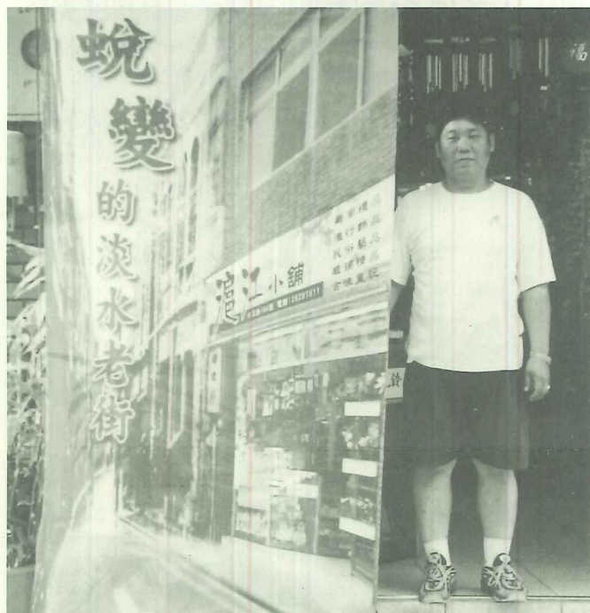
淡水老街變遷快速反映在店旗創作上

最後，在檢視的過程中，不是因為不滿意；不是因為做不好，只因期待它永續的開展；期待更多人的參與；期待因此有了生活的變化；期待...，在自覺我是「淡水人」的那一天起！