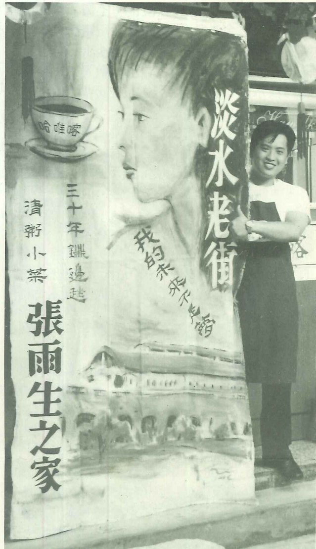
文化賽旗創作表達店家經營的精神及周遭環境特色