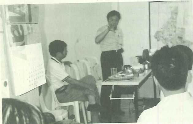
地方人士關心公司田溪河川整治計劃，6月8日於滬尾文史工作室召開座談會議